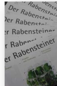
Werbematerialien im Foyer